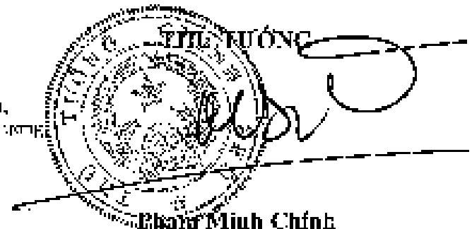
Phạm Minh Chính